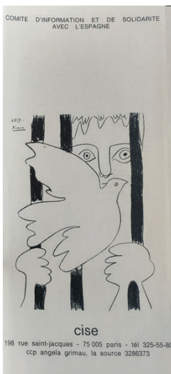
CISE. París, 1975. AMA, carp. CISE.

No obstante, en el dossier de 1971 se utilizó un grabado de José Ortega en defensa de la amnistía, que representaba a mujeres y hombres en prisión: