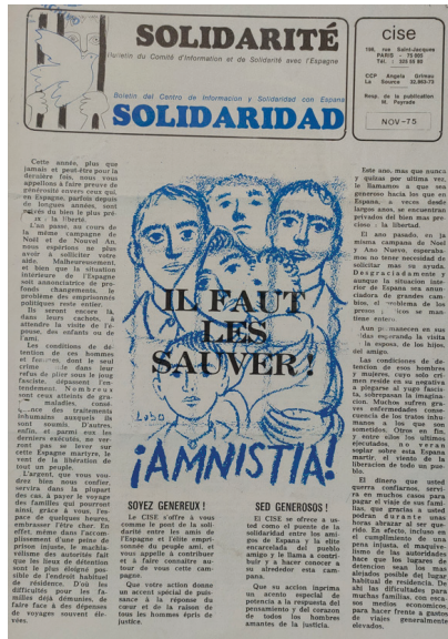
Solidaridad . París, noviembre de 1975. AHPCE. Represión franquista, Caja 47.4 CISE.